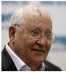
Mikhaïl Gorbatchev (Prix Nobel de la Paix, dernier président de l'URSS)

"Dans le contexte économique actuel, les armes nucléaires représentent un gouffre financier sans fond."