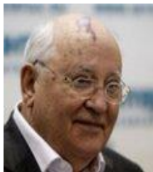
Mikhaïl Gorbatchev (Prix Nobel de la Paix, dernier président de l'URSS)

"C'est au contribuable de payer la recherche et le développement du nucléaire, sinon le kWh d'électricité nucléaire ne serait plus compétitif"