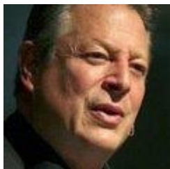
Albert Gore (Prix Nobel de la Paix, ex-Vice-Président des États-Unis)

"Les pro-nucléaires font beaucoup de bruit, mais ils n'ont pas d'avenir"