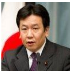
Yukio Edano (ex-ministre du commerce et de l'industrie du Japon)

"Les horribles souvenirs de Tchernobyl et maintenant de Fukushima sont trop frais et trop frappants pour qu'on s'autorise à méditer tout autre choix que celui de mettre fin à notre dépendance à l'énergie nucléaire."