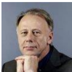
Jürgen Trittin (ex-ministre allemand de l'environnement et de la sûreté nucléaire)

"Fukushima nous a déjà appris quelque chose. Nous avons, sans doute, sous-estimé le cumul des situations, la perte d'alimentation électrique et celle des sources froides par exemple. Ce qui nous oblige désormais à remettre en cause un certain nombre de certitudes. Ce qui est toujours positif. Mais nous sommes encore loin d'avoir tiré tous les enseignements."