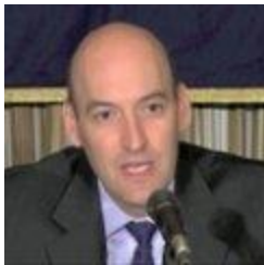
Gregory Jaczko (ex-président de l'autorité de sûreté nucléaire des États-Unis)

"J'ai toujours veillé à ce que le nucléaire civil et le nucléaire militaire aillent de pair... Ce serait la mort du deuxième si le premier disparaissait".