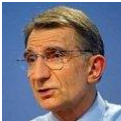
François Roussely (ex-PDG d'EDF)

"Puisque chacun des plus de 400 réacteurs nucléaires qui fonctionnent actuellement dans 32 pays produit de grandes quantités de plutonium qui, une fois chimiquement séparées du combustible utilisé, peuvent être utilisées pour fabriquer des armes nucléaires de tout type, fiables et efficaces, j'estime nécessaire d'en appeler à un arrêt total et mondial de l'utilisation de l'énergie nucléaire."