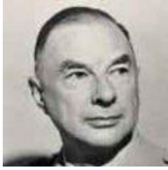
Général Charles Ailleret (un des pères de la bombe atomique française)

"J'ai toujours veillé à ce que le nucléaire civil et le nucléaire militaire aillent de pair... Ce serait la mort du deuxième si le premier disparaissait".