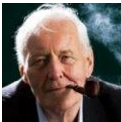
Tony Benn (ex-ministre chargé du programme nucléaire britannique)

"Peu d'investisseurs acceptent dans une logique de marché de prendre le risque d'investir dans un réacteur nucléaire à moins que les pouvoirs publics définissent un cadre adapté prenant en charge une partie du risque."